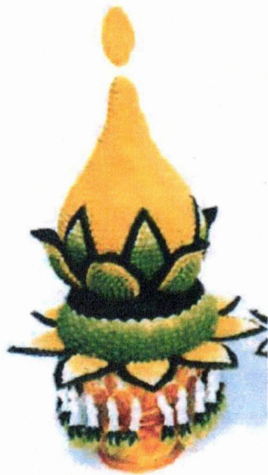
ตัวอย่าง พานพุ่มดอกไม้สด(ทรงพุ่มข้าวบิณฑ์) (ดอกไม้โทนสีเหลือง)